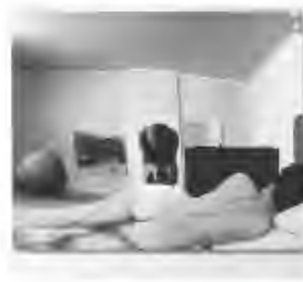
Sala di Michelangelo Pistoletto, Vitalità del Negativo, Palazzo delle Esposizioni, Roma, 1970 Gelatin silver print on baritated paper on board. 58 x 63 x 4 cm Edition of 28 Inv. 20532