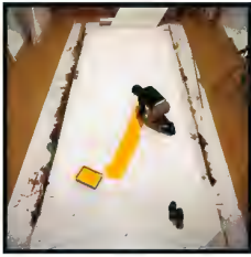
Kenneth Noland. Vermont, 1965 Pigment inkjet print on cotton fine-art paper 63 x 58 x 4 cm Edition of 7 Inv. 20527