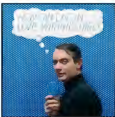
Roy Lichtenstein. New York, 1964 Pigment inkjet print on cotton fine-art paper 63 x 58 x 4 cm Edition of 7 Inv. 20530