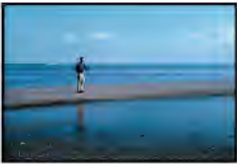
Jasper Johns. Edisto Beach, 1965 Pigment inkjet print on cotton fine-art paper 63 x 58 x 4 cm Edition of 7 Inv. 20528