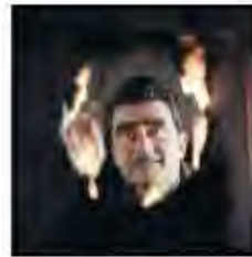
Alberto Burri, Roma, 1961 Pigment inkjet print on cotton fine-art paper 63 x 58 x 4 cm Edition of 7 Inv. 20535