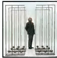
Fausto Melotti, Milano, 1968 Pigment inkjet print on cotton fine-art paper 63 x 58 x 4 cm Edition of 7 Inv. 20533