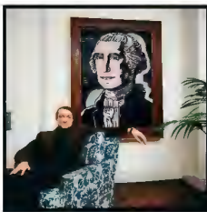
Roy Lichtenstein, New York, 1964 Pigment inkjet print on cotton fine-art paper 63 x 58 x 4 cm Edition of 7 Inv. 20531