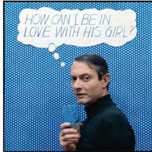
Roy Lichtenstein. New York, 1964

Témoin majeur de la vie artistique en Italie, Mulas a également documenté d'une manière exceptionnelle les plus grandes expositions de son temps, telle que Sculture nella città à Spoleto en 1962 ou encore Vitalità del negativo nell'arte italiana 1960/70 présentée au Palazzo delle Esposizioni à Rome en 1970. Les vues de cette dernière rendent compte de manière magistrale les œuvres des 34 artistes participants, reflétant la diversité des courants artistiques de l'époque. Dans la salle dédiée au travail de Michelangelo Pistoletto, Mulas réalise un subtil autoportrait au miroir.