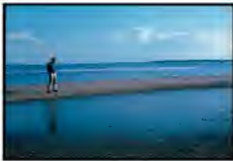
Jasper Johns. Edisto Beach, 1965 Pigment inkjet print on cotton fine-art paper 63 x 58 x 4 cm Edition of 7 Inv. 20529